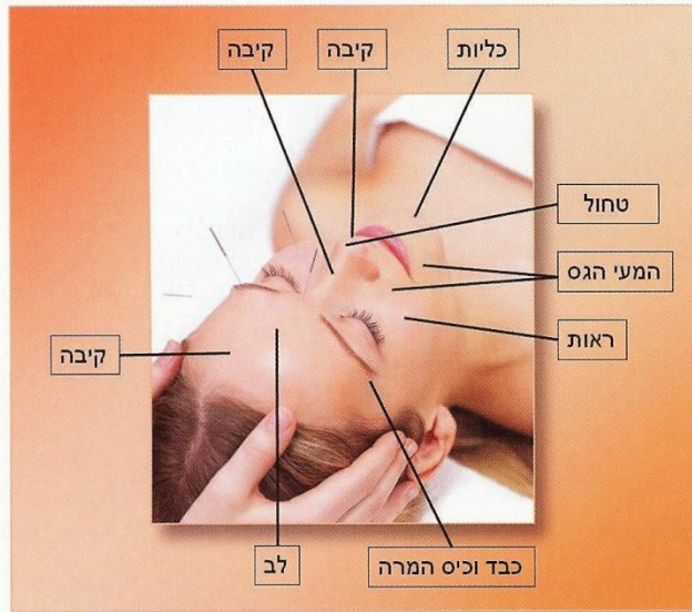
אחת מהגישות הקלאסיות לאבחון פנים - TCM

התבוננות מעמיקה בפנים יכולה לספק לנו הבנה מעמיקה ויסודית על מצבו הבריאותי של המטופל. על פי גווני הפנים, איכות העור, מבנה פיזיולוגי, קמטים ופגמים, מיקומו של כל קמט בפנים יבנה לנו דיאגנוזה כמעט מושלמת על מצבו הפיזי, האנרגטי והנפשי. מטפל מנוסה, לעיתים מזומנות, מאבחן את מטופליו ברגע שנכנסו אליו לקליניקה. התבוננות באיכות ה-SHEN היא האבחנה החשובה מכולן ומושגת מיד בהתרשמות הראשונה היות ואיכות ה-SHEN מעידה על החיוניות והויטאליות של האדם כמכלול. ה-SHEN ניכר בעיקר בעיני המטופל ולכן אדם אשר עיניו בורקות, מלאות שמחה וחיות, גוון פניו אינו חיוור, הנשימה סדירה וקצובה, דיבורו בעל רצף והגיון, נסיק שככל הנראה הוא אדם בריא.